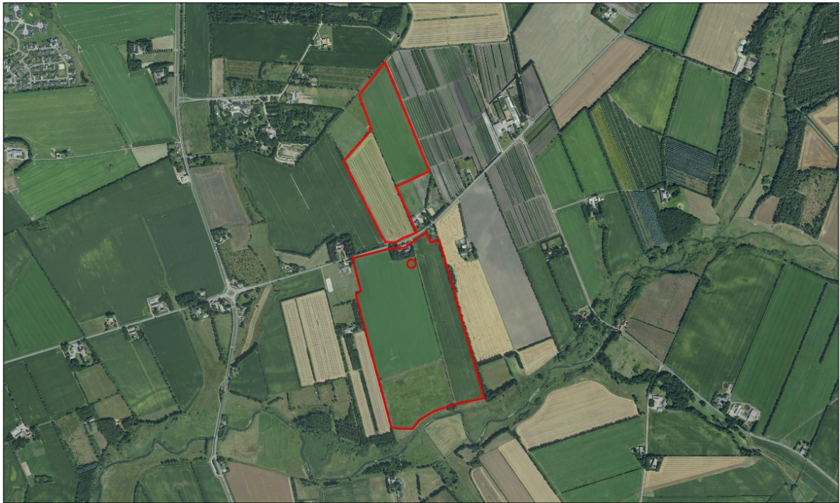
Figur 2. Udbringningsarealer der tilhører Kongeåvej 13.

Der må udbringes 2.083 m 3 på udbringningsarealet (49 ha x 170kg N/ha / 4 kg N/ton, hvor 1 ton = 1 m 3 ).