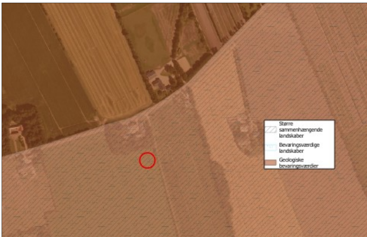
Figur 4. Anlæggets placering i landskabet.

Gyllebeholderen er placeret inden for "Større sammenhængende landskaber", "Bevaringsværdige landskaber og 'Geologiske bevaringsværdier', se ovenstående figur og tabel.