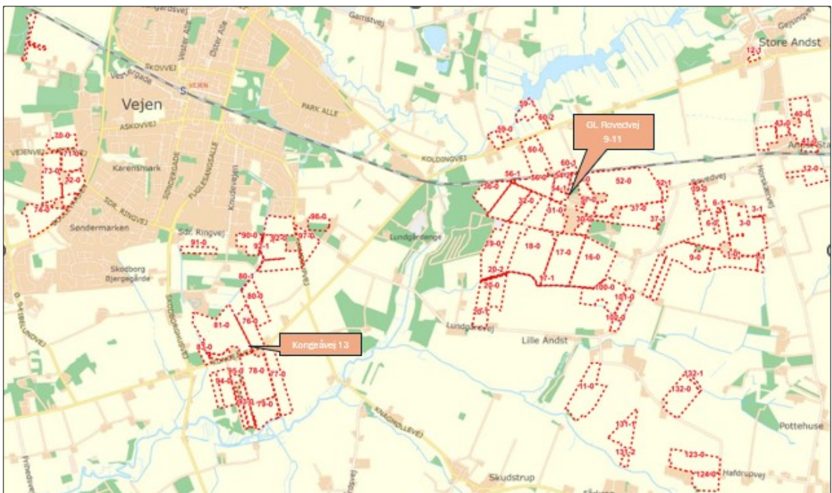
Figur 3. Udbringningsarealer der drives af ansøger.

Det er kommunens vurdering at størrelsen på den ansøgte gyllebeholder stemmer overens med den mængde husdyrgødning der må udbringes på udbringningsarealerne omkring ejendommen.