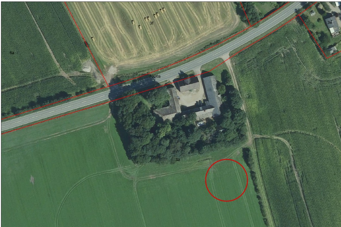
Figur 1. Placering af den ansøgte gyllebeholder.

Gyllebeholderen placeres umiddelbart syd for eksisterende bygninger, se nedenstående figur.